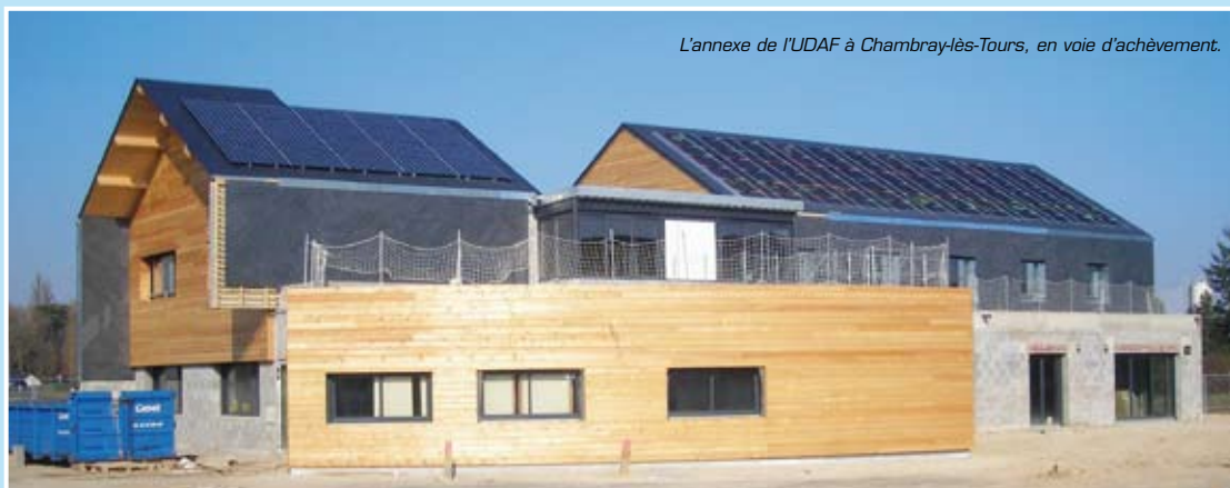
L'annexe de l'UDAF à Chambray-lès-Tours, en voie d'achèvement.

Ces locaux accueilleront les services de mesures de protection et d'accompagnement « Agnès Sorel » et « François Rabelais » dont l'activité se situe en partie sur le sud du département.