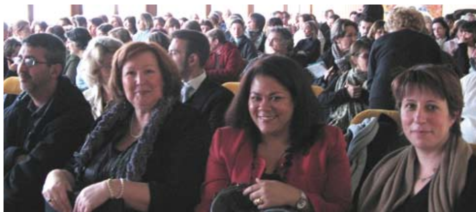
L'assistance avant la conférence.

Mais quelle que soit la forme qu'elle prenne, on comprend que, dans toutes les sociétés, les individus, les groupes sociaux ont des intérêts à la solidarité, à l'entraide : intérêt de recevoir pour celui qui est aidé, mais intérêt d'obtenir ou de conserver une utilité sociale (plus ou moins consciemment) pour celui qui aide, d'autant plus dans une société où la solidarité affichée est très valorisée.