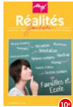
n°102-103 | 2013 Familles et Ecole