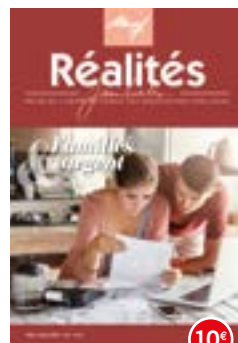
n°118-119 | 2017 Familles & argent