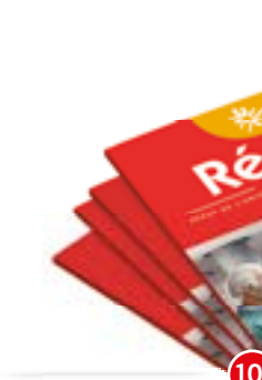
n°132-133 | 2020 Familles face à la crise sanitaire