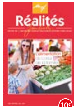
n°108-109 | 2014 L'alimentation au cœur des familles