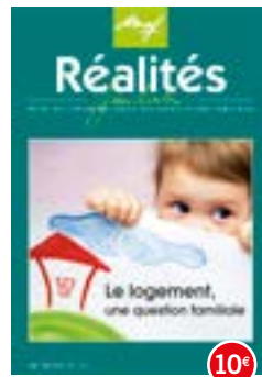
n°98-99 | 2012 Le logement, une question familiale