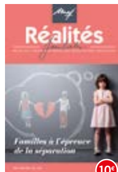
n°122-123 | 2018 Familles à l'épreuve de la séparation