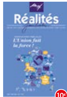
n°112-113 | 2015 Associations Familiales L'Union fait la force !