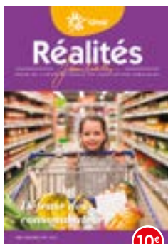
n°126-127 | 2019 Défense des consommateurs