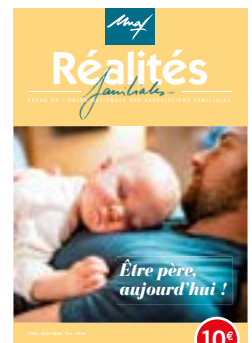
n°124-125 | 2018 Être père, aujourd'hui !