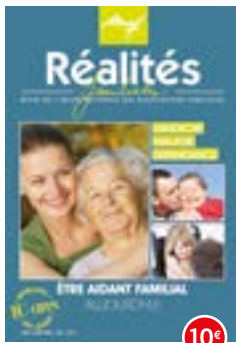
n°106-107 | 2014 Être aidant familial aujourd'hui