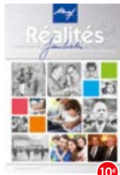
n°110-111 | 2015 Numéro spécial 70 ans d'engagements pour les familles