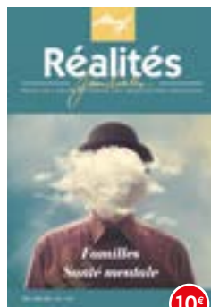
n°120-121 | 2017 Familles & santé mentale