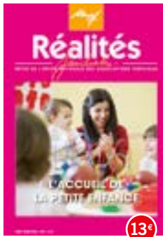
n°95-96-97 | 2011 L'accueil de la petite enfance

Pour tout savoir sur tout ce qui touche à la vie quotidienne des familles : logement, santé, éducation, consommation...