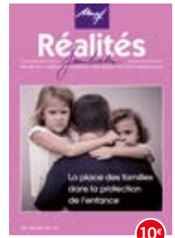
n°104-105 | 2014 La place des familles dans la protection de l'enfance