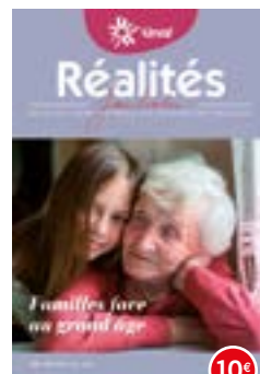
n°128-129 | 2019 Familles face au grand âge