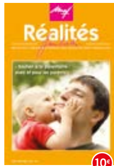
n°100-101 | 2012 Soutien à la parentalité avec et pour les parents