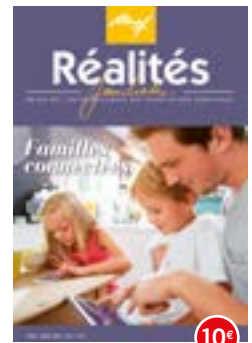
n°114-115 | 2016 Familles connectées