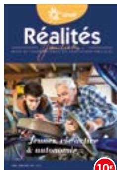
n°130-131 | 2020 Jeunes, vie active et autonomie