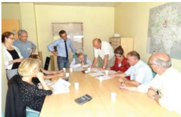
Dépouillement des votes