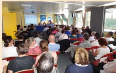
Déroulement de l'assemblée générale

Au 31 décembre 2011, après vérification de la commission de contrôle de l'UNAF, le nombre des associations actives de l'UDAF d'Indre et Loire s'élève à 103 avec un nombre d'adhérents total établi à 7308.